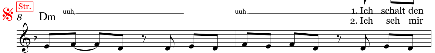
Bild- schirm ab und mach das Ra - di - o aus, will kei - nen Au - gen an und seh dann wie - de - rum weg, ich hör den Hän - de hoch und hab dein Kreuz an - ge - fasst, Ich trug es